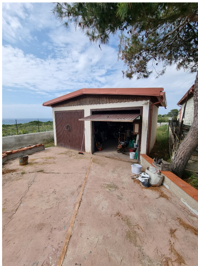
Rifacimento dell'impermeabilizzazione del solaio di copertura del locale di sgombero previa rimozione e successiva posa in opera delle tegole esistenti;