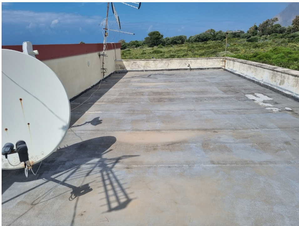
Rifacimento dell'impermeabilizzazione con guaina del solaio piano