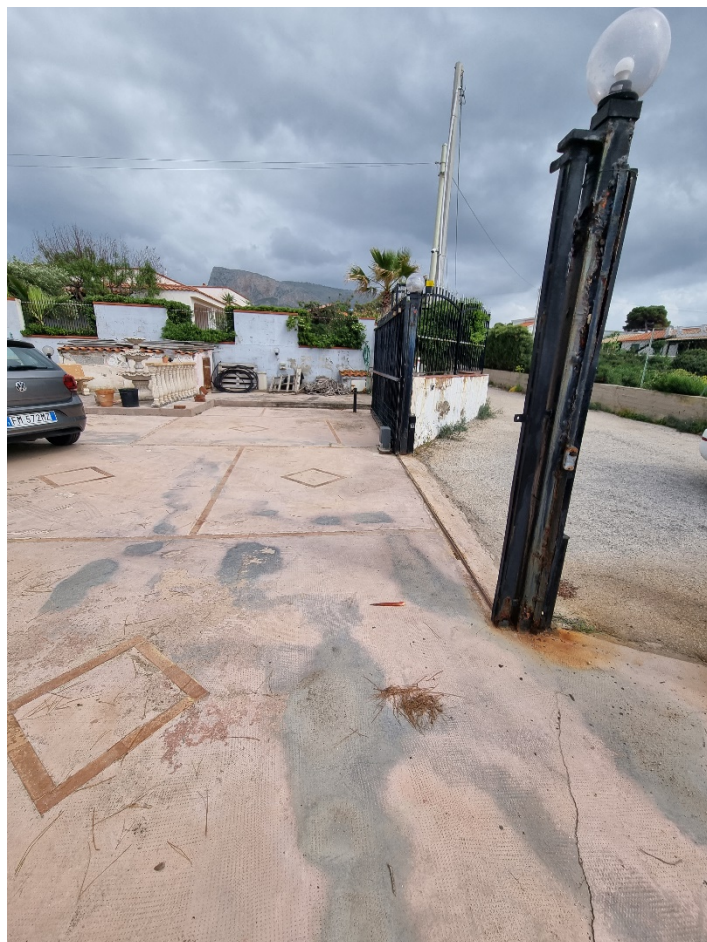
Sostituzione dei pilastri in ferro di sostegno del cancello e del cancelletto di ingresso compreso di binario e trave di fondazione in calcestruzzo